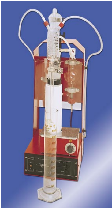
WE 1/H mit GSPH