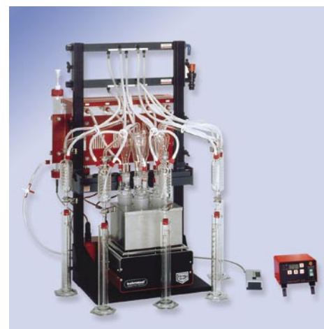
WE 5 Ammonium- Stickstoff