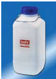
Kanister WB 5