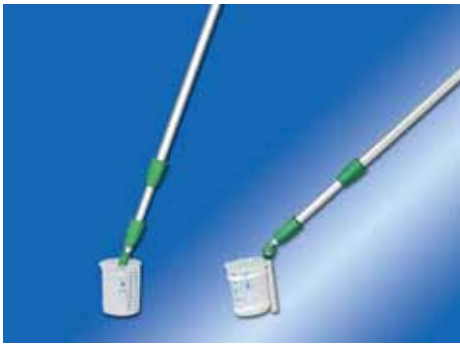
Entnahmeschöpfer ESU (l) und ESO (r)