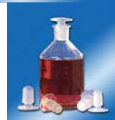
Probennahmeflaschen mit massivem Glasstopfen