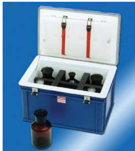
Isolierter Probentransportbehälter ITB