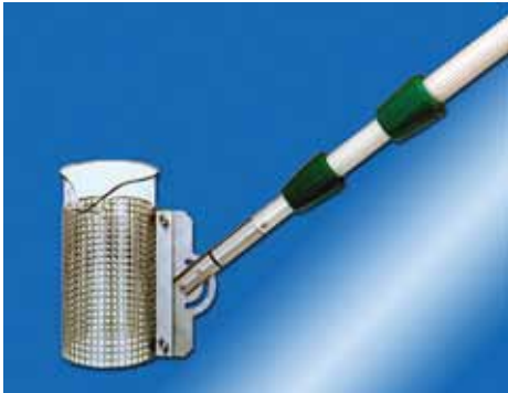
Probennahmeschöpfer PB 1000

Entnahmeschöpfer ESU mit Pendelhalterung. Besonders geeignet für die Entnahme von Schöpfproben aus engen Schächten. 3teiliger Teleskopstab, ausziehbar bis 3 m Länge. Graduierter Becher aus PP mit Ausguss, Inhalt 1 l